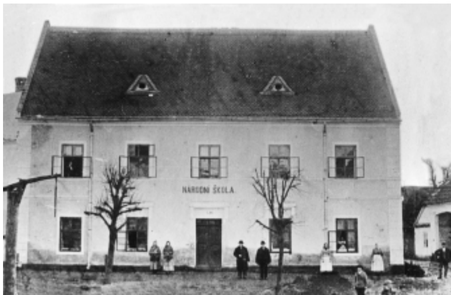
Stará školní budova na náměstí.

Roku 1902 bylo nutné otevřít čtvrtou třídu na radnici. Bylo potřeba řešit