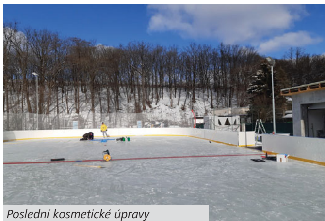
Poslední kosmetické úpravy