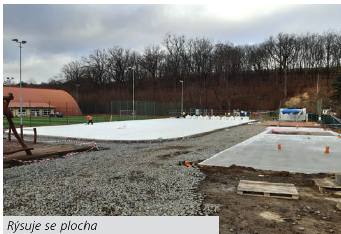
Rýsuje se plocha