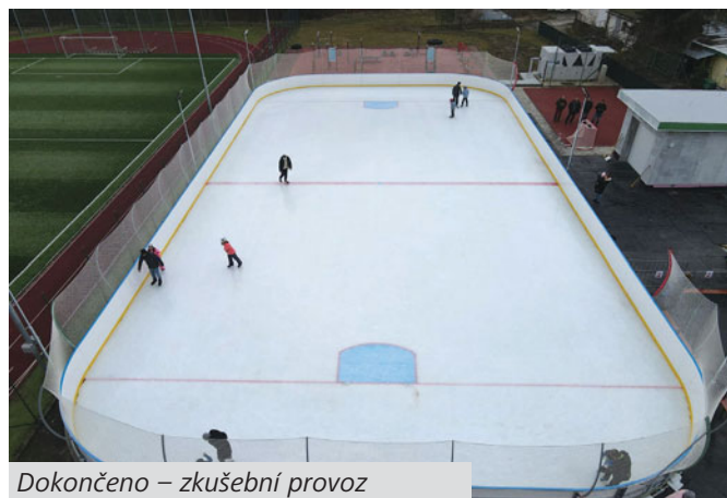
Dokončeno – zkušební provoz

V tuto dobu probíhala jednání s firmami, kterým jsme sdělili naše představy a hlavně podmínky k uchlazení plochy. Žádná z těchto firem nebyla schopna zajistit prochlazení ledové plochy při venkovní teplotě nad 8°C, což nám přišlo zcela nevyhovující. Podle slov lidí pohybujících se v „chladařském“ průmyslu, jsou