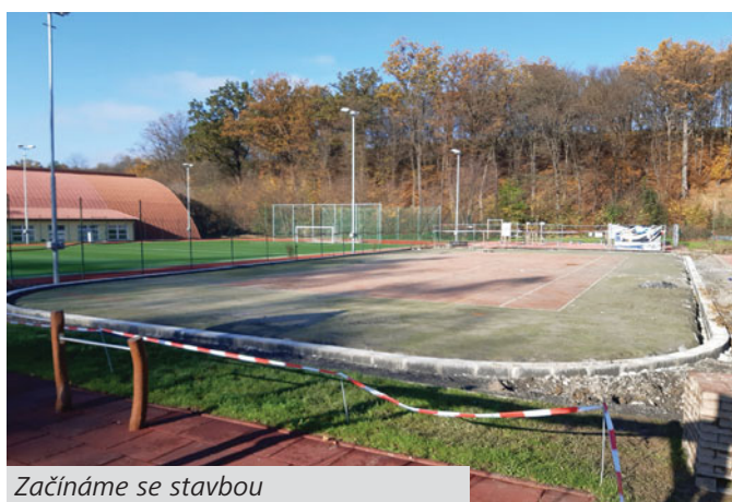
Začínáme se stavbou